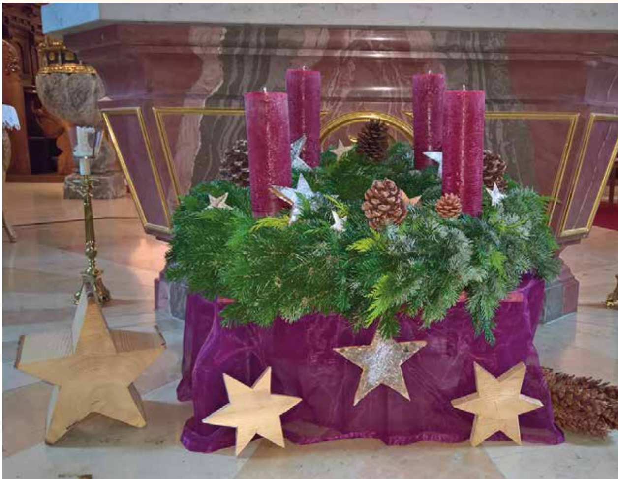
Adventskranz Kirche Wangen